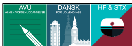
Indgangsportalen (Mit VUF)