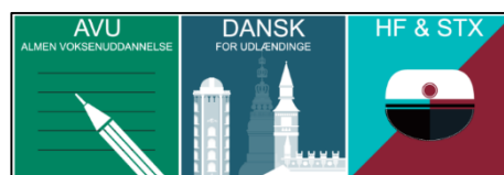
Indgangsportalen (Mit VUF)